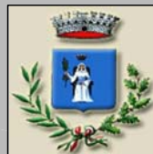
COMUNE DI SANTA MARINA